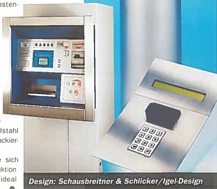
Design: Schaubreitner & Schlicker/Igel-Design

Schauen Sie sich an, wie sich Funktion und Design ideal ergänzen können! ●